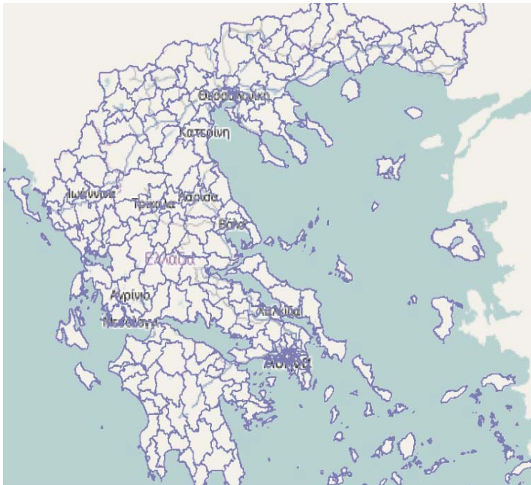
Εικόνα 2. Διοικητικά όρια Δήμων Ν. 3852/2010

Εν συνεχεία με το νόμο 3852/2010 «Νέα Αρχιτεκτονική της Αυτοδιοίκησης και της Αποκεντρωμένης Διοίκησης - Πρόγραμμα Καλλικράτης», ο οποίος ισχύει σήμερα, συνενώνονται περαιτέρω οι υπάρχοντες μικροί Δήμοι σε μεγαλύτερους (εικ.2) και αντικαθίστανται οι νομαρχίες από τις περιφέρειες. Αλλάζει ακόμα ο τρόπος χρηματοδότησης τους, αυξάνεται η θητεία των οργάνων σε 5 έτη και ανακατανέμονται οι αρμοδιότητες κάθε τοπικού οργάνου.