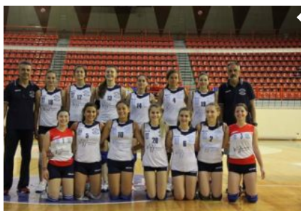
Παγκορασίδες «Γαία» Δράμας Στις 6 καλύτερες ομάδες της Ελλάδας Ο πρόεδρος της Γαία και ο προπονητής της ομάδας μιλούν στον «Π.Τ.»