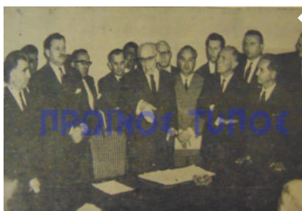
Ο Π.Τ Πριν 55 Χρόνια 19 ΑΠΡΙΛΙΟΥ 1963 Ο ΥΠΟΥΡΓΟΣ ΓΕΩΡΓΙΑΣ ΕΙΣ ΤΗΝ ΠΟΛΙΝ ΜΑΣ