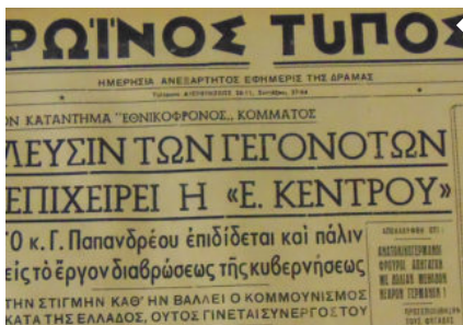
Ο Π.Τ Πριν 55 Χρόνια 24 ΜΑΙΟΥ 1963