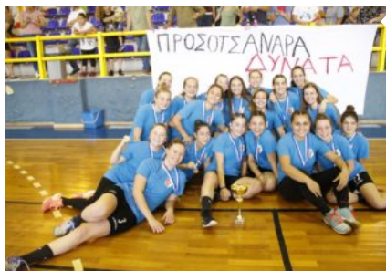
Χάντμπολ Πρωταθλητής ο ΑΟ Προσοτσάνης