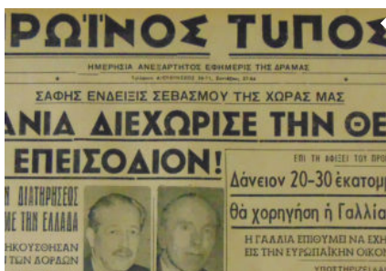
Ο Π.Τ Πριν 55 Χρόνια 10 ΜΑΙΟΥ 1963