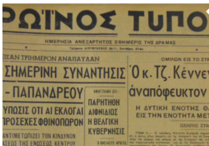
Ο Π.Τ Πριν 55 Χρόνια 3 ΙΟΥΛΙΟΥ 1963